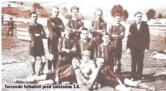
Turzovskí futbalisti pred založením Š.K.