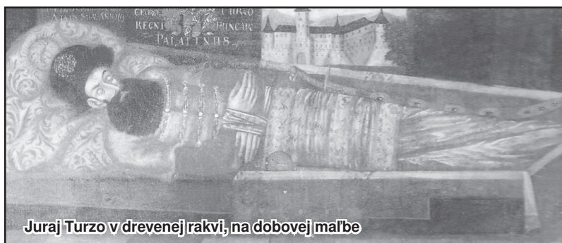
Juraj Turzo v drevenej rakvi, na dobovej maľbe

Za Juraja Turzu prežívala Bytča dobu svojho rozkvetu. Ako hostia sa tu zjavovali významné osobnosti vtedajšej doby. Turzo pozval do Bytče viacerých významných pedagógov. Ich podporu tu vzniklo gymnázium, z ktorého sa odchádzalo na domáce, aj zahraničné univerzity, najmä do Wittenbergu, Krakova a Bazileja. V zámku bola na tie časy bohatá, viac ako 800 zväzková knižnica. Renesančné kultúrne prostredie v Bytči vytvárali aj architektonické a umelecké diela, ktoré dodnes patria k skvostom renesančného umenia. Vznikli pôsobením skupiny talianskych umelcov, kamenárov a maliarov žijúcich v Byt-