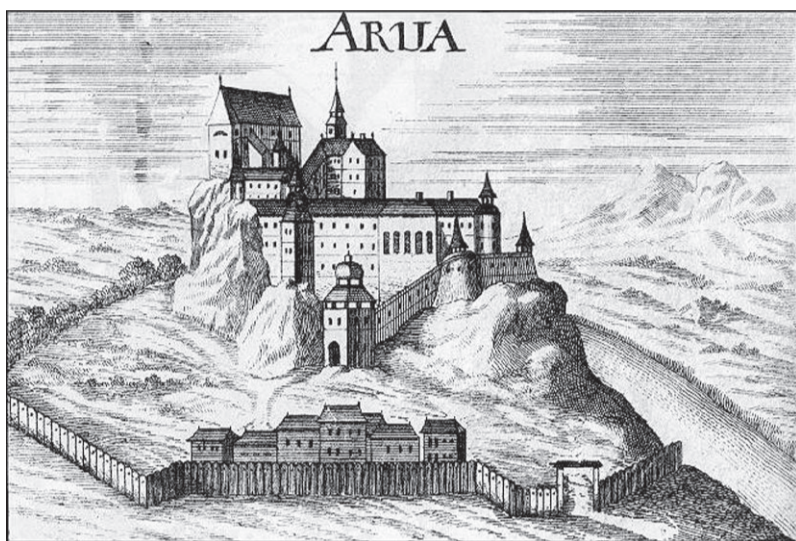
Oravský hrad, miesto posledného odpočinku Turzovcov (dobová medirytina z roku 1680)

Po smrti Juraja Turzu v zmysle palatínovho testamentu sa hlavnej správy majetkov ujala jeho vdova Alžbeta Coborová. Za palatínovej častej neprítomnosti v Bytči už v predchádzajúcich rokoch kontrolovala a schvaľovala činnosť správcov jednotlivých panstiev. Táto jej činnosť pokračovala