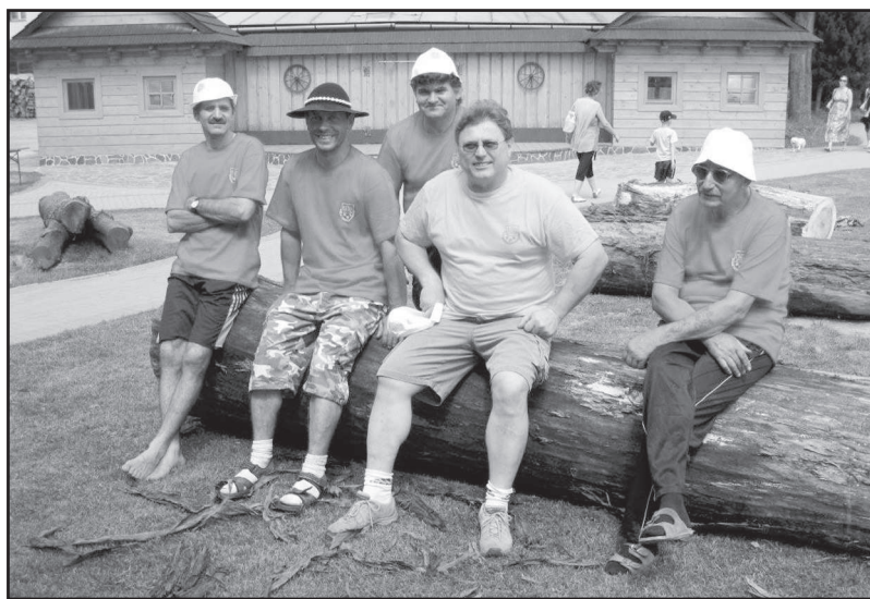
Rezbári v spolkových tričkách

Od utorka 14. do soboty 18. júla, počas piatich horúcich letných dní sa priestorom turzovského sídliska Šarky ozýval zvuk motorových píľ a ťukanie dlát. Nevšedná zvuková kulisa „zapadla“ do stavebného ruchu pri novovznikajúcom námestí, kde sa horúčkovite pracuje na zásadnej zmene priestoru, ktorý Turzovke vtlačí novú tvár a jej obyvateľom a návštevníkom poskytne dôkaz o príkladnej starostlivosti samosprávy o tvorbu a estetizáciu životného prostredia. Štvrtý rezbársky plenér DREVENÉ TAJOMSTVÁ skončil s výsledkom hodným obdivu. Šarkpark bol „zahustený“ postavami troch nových muzikantov tak, že vytvárajú jeden celok a umocňujú zážitok z pobytu v tomto priestore, kde sa konajú hudobné produkcie, podujatia ľudovej a spoločenskej zábavy. Svoj dar dostali aj turzovskí hasiči v podobe svojho patróna – Svätého Floriána. Aj ten už stojí v priestore Areálu športu a oddychu, na mieste, kde prebiehajú tradičné súťažné podujatia hasičského športu a ľudovej zábavy. Socha Panny Márie na svoje umiestnenie čaká do doby, kedy sa priestor na