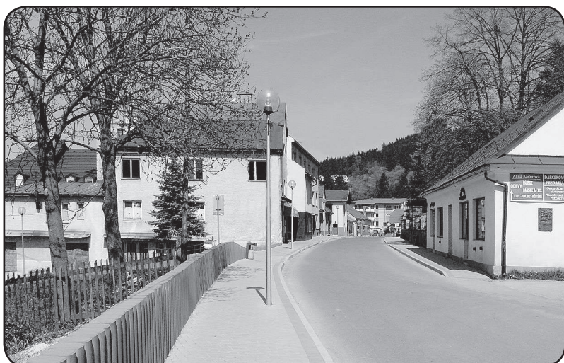
Ulica R. Jašíka v Turzovke – budova bývalej cirkevnej školy vpravo.

Želáme im všetko najlepšie, hlavne pevné zdravie a v ďalšom živote veľa šťastia, úspechov a rodinnej pohody.