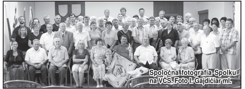
Spoločná fotografia Spolku na VČS.

Novým členom boli vydané členské preukazy s číslom 0180 a 0181.