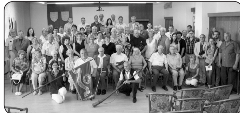
Členovia Spolku priateľov Turzovky – účastníci VČS 13.8.2010